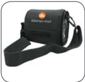
IP54 Gehäuse für OC3