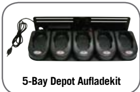
5-Bay Depot Aufladekit